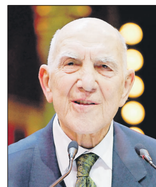
Stéphane Hessel, 93-letni upornik