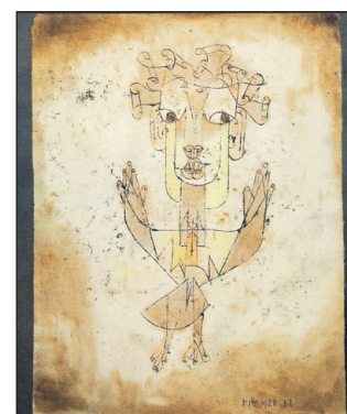
Paul Klee, Angelus novus, akvarel, 1920.