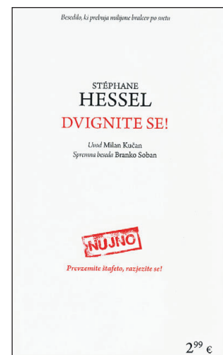
Naslovnica manifesta, oblikoval Luka Umek