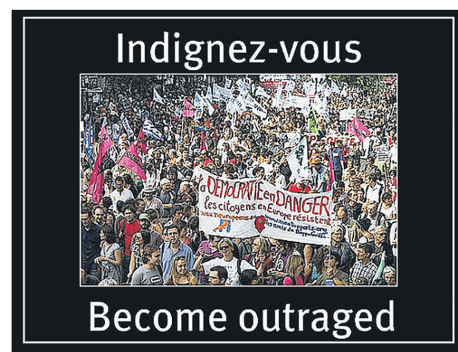
Plakat: Dvignite se! Razjezite se!