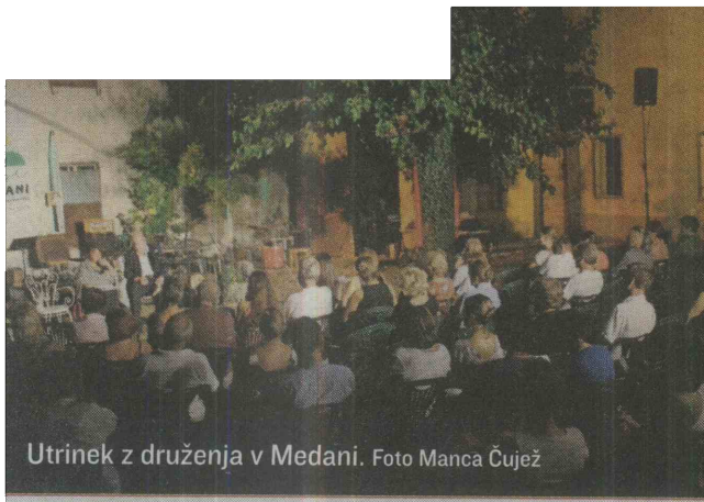
Utrinek z druženja v Medani.