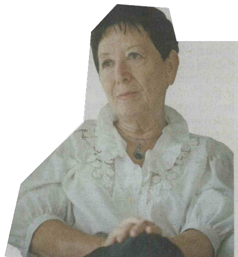
Obiskala nas bo mednarodno uveljavljena turška pisateljica Oya Baydar.