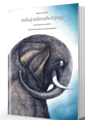
V polnem zaupanju nastane lahko nekaj zelo zelo lepega.