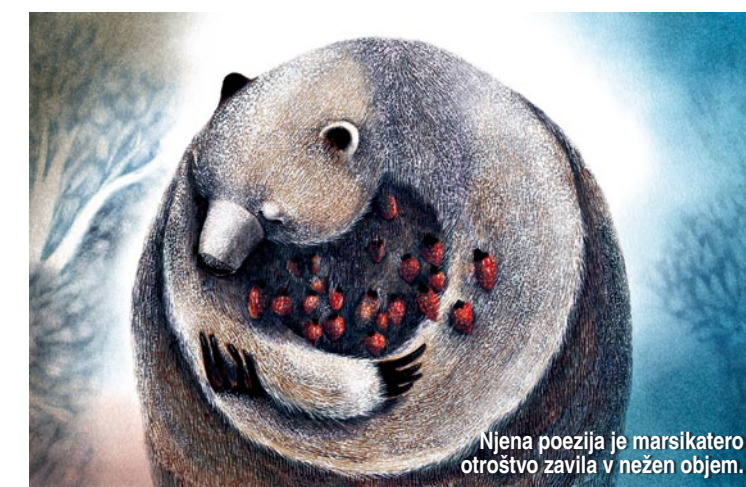
Njena poezija je marsikatero otroštvo zavila v nežen objem.