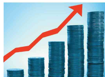
Vrednost denarja se mora prenesto podvajati.

marsičesa naučijo. Poznamo pa tudi sodobne variacije na temo, prilagajene potrebam in delovanju moderne družbe. O tem pa več v naslednji številki revije.